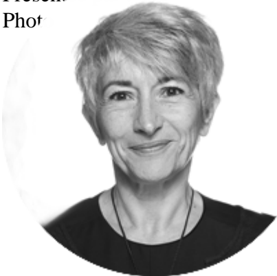
Catherine TISSOT-COLLE Ancienne Phot