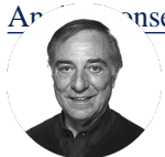
Allain BOUGRAIN DUBOURG