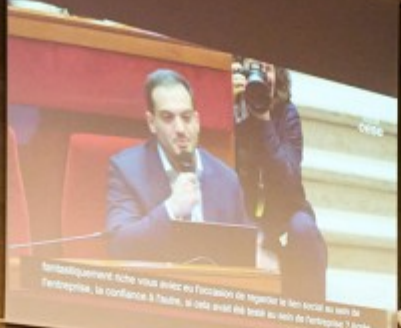
Sociologiquement riche vous avez eu l'occasion de regarder le lien social au sein de l'entreprise, la confiance à l'avenir, si cela avait été traité au sujet de l'entreprise ? Après

par Bruno CAUTRÈS, chercheur CNRS au CEVIPOF et politologue