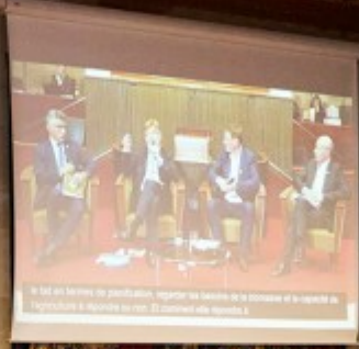
Le 14 au 16 mars 2023, rapporteur la loi de la souveraineté et la capacité de l'agriculture à répondre au ren. Et comment cela répondra à