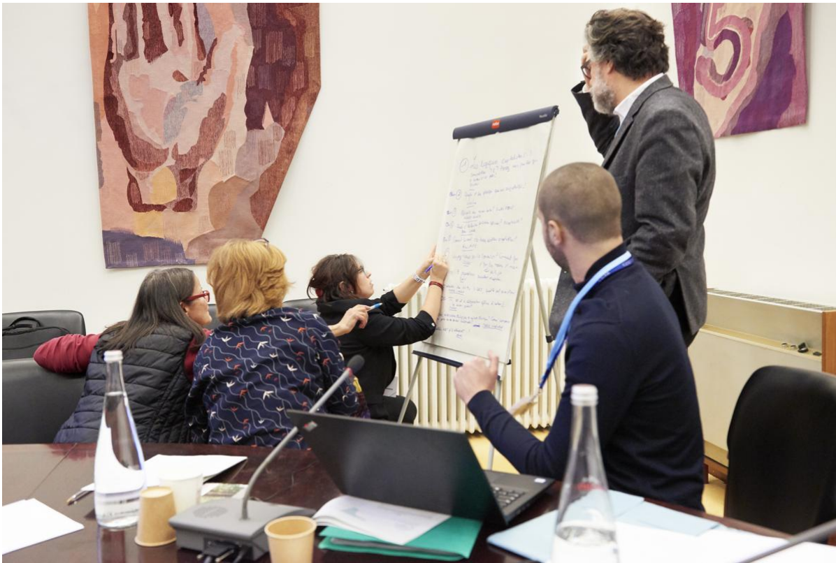
Des membres de la Convention lors d'une réunion de travail